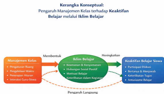
Gambar .2 Kerangka Konseptual

Dengan mengedepankan kebijaksanaan serta kepekaan terhadap dinamika yang terjadi di dalam kelas (Iskandar et al., 2024), guru mampu membangun lingkungan belajar yang mendukung terciptanya rasa aman, menumbuhkan rasa ingin tahu, serta memotivasi semangat belajar siswa (Firdaus et al., 2024). Melalui penerapan manajemen kelas yang efektif, setiap peserta didik diberikan kesempatan yang seluas-luasnya untuk mengembangkan potensinya secara optimal (Juniarti, 2023). Selain itu, siswa juga didorong untuk aktif berpartisipasi, bekerja sama, serta benar-benar terlibat dalam seluruh proses pembelajaran yang berlangsung (Islam & Alauddin, 2025).