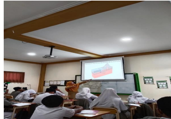
Gambar.2 Menciptakan Iklim Belajar Kondusif

Dengan mengedepankan kebijaksanaan serta kepekaan terhadap dinamika yang terjadi di dalam kelas (Iskandar et al., 2024), guru mampu membangun lingkungan belajar yang mendukung terciptanya rasa aman, menumbuhkan rasa ingin tahu, serta memotivasi semangat belajar siswa (Firdaus et al., 2024). Melalui penerapan manajemen kelas yang efektif, setiap peserta didik diberikan kesempatan yang seluas-luasnya untuk mengembangkan potensinya secara optimal (Juniarti, 2023). Selain itu, siswa juga didorong untuk aktif berpartisipasi, bekerja sama, serta benar-benar terlibat dalam seluruh proses pembelajaran yang berlangsung (Islam & Alauddin, 2025).