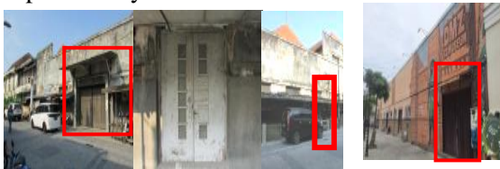
Gambar 5. Perbedaan Perubahan Pintu Tahun 2016 dan Tahun 2022 GCT Van Dorp & Co Semarang

Kondisi pintu rolling door pada tahun 2016 sebagai akses pekerja, sekarang mengalami pemindahan dan adanya penghilangan pintu asli bangunan sebagai maksud mengikuti fungsi adaptasi yang baru, akan tetapi tindakan ini cukup kurang baik. Dikarenakannya ada pintu bangunan cagar budaya yang dihilangkan dan tidak dikembalikan sebagaimana mestinya. Memberi dampak berkurangnya nilai estetika eksterior seperti aslinya.