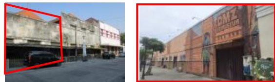
Gambar 2. Perbedaan tampak eksterior Tahun 2016 dan Tahun 2022 GCT Van Dorp & Co Semarang

Terdapat lukisan manual secara langsung pada dinding yang dimana bangunan ini masih menjadi satu kesatuan bangunan cagar budaya bangunan Percetakan GCT Van Dorp & Co. Adalah salah satu tindakan yang kurang baik pada bangunan cagar budaya. Pada bangunan depan antara jalan Letjen Suprpto dengan jalan Branjangan mengalami perubahan fasad yang dimana hanya tambahan dan tidak menghilangkan kondisi fasad aslinya dapat dilihat dari dalam bangunan dapat dilihat jendela tidak mengalami perubahan. Dan adanya penemuan perubahan jendela yang dilakukan secara permanen agar dapat mengikuti bentuk fasad yang ada pada saat ini. Perubahan jendela adalah tindakan yang kurang bijaksana dalam melakukan konservasi pada bangunan.