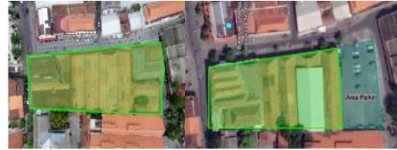
Gambar 1. Tampak Atas Tahun 2016 dan Tahun 2022 GCT Van Dorp & Co Semarang

ini dihancurkan dan dijadikan salah satu pendukung kantong lahan parkir.