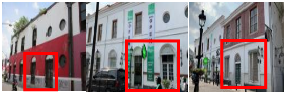
Gambar 6. Perbedaan Perubahan Jendela, Pintu Tahun 2016 dan Tahun 2022 GCT Van Dorp & Co Semarang

Bangunan ini pernah digunakan oleh IAI yang lebih dikenal dengan bangunan merah. Pada saat ini kondisi jendela yang sudah diganti dengan material yang baru sesuai dengan bentuk dan spesifikasi bangunan aslinya. Ada pula jendela yang diubah menjadi pintu menyesuaikan kebutuhan fungsi adaptasi yang ada pada jaman sekarang. Penambahan jendela krepak untuk mendukung keselarasan fasad yang ada pada jalan Branjangan seperti tahun 1755.