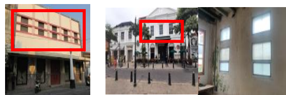
Gambar 3. Perbedaan Perubahan Fasad Tahun 2016 dan Tahun 2022 GCT Van Dorp & Co Semarang

Terdapat lukisan manual secara langsung pada dinding yang dimana bangunan ini masih menjadi satu kesatuan bangunan cagar budaya bangunan Percetakan GCT Van Dorp & Co. Adalah salah satu tindakan yang kurang baik pada bangunan cagar budaya. Pada bangunan depan antara jalan Letjen Suprpto dengan jalan Branjangan mengalami perubahan fasad yang dimana hanya tambahan dan tidak menghilangkan kondisi fasad aslinya dapat dilihat dari dalam bangunan dapat dilihat jendela tidak mengalami perubahan. Dan adanya penemuan perubahan jendela yang dilakukan secara permanen agar dapat mengikuti bentuk fasad yang ada pada saat ini. Perubahan jendela adalah tindakan yang kurang bijaksana dalam melakukan konservasi pada bangunan.