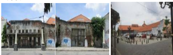
Gambar 7. Perbedaan Perubahan Bangunan yang Hilang Tahun 2016 dan Tahun 2022 GCT Van Dorp & Co Semarang

Bangunan ini pernah digunakan oleh IAI yang lebih dikenal dengan bangunan merah. Pada saat ini kondisi jendela yang sudah diganti dengan material yang baru sesuai dengan bentuk dan spesifikasi bangunan aslinya. Ada pula jendela yang diubah menjadi pintu menyesuaikan kebutuhan fungsi adaptasi yang ada pada jaman sekarang. Penambahan jendela krepak untuk mendukung keselarasan fasad yang ada pada jalan Branjangan seperti tahun 1755.