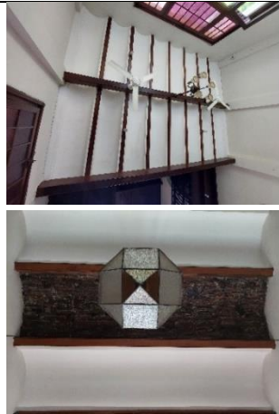
Perbaikan menyeluruh namun masih harus tetap sesuai dengan aslinya.

Dilakukan usaha pembersihan secara menyeluruh. Dilakukan penambalan pada bagian yang rusak. Melakukan pengecatan ulang sesuai dengan aslinya.