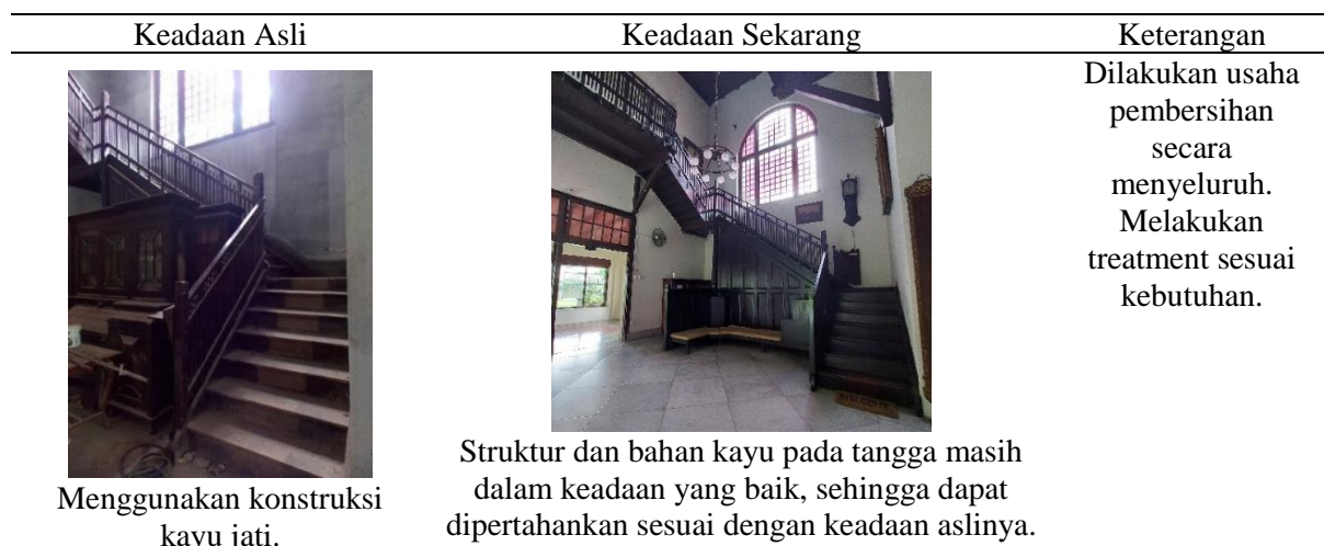
Tabel 2 Tindakan Konservasi Tangga dan Plafon Sumber : Analisis Penulis 2022

beberapa prinsip utama konservasi yaitu, keaslian bangunan dalam segala aspek yang ada serta intervensi seminimal mungkin sesuai dengan kebutuhan bangunan tersebut. Bangunan rumah tinggal Fletterman dibangun menggunakan bahan utama batu bata dan kayu jati yang dapat lapuk karena usia, cuaca dan kurangnya perawatan berkala. Keadaan umum struktur utama bangunan ini masih cukup kokoh, kerusakan pada bagian tertentu akan mendapatkan penanganan pekerjaan rehabilitasi dan pekerjaan konservasi. Contohnya pada bangian tangga. Tangga yang ada pada rumah tinggal Flatlerman menggunakan kayu jati yang masih kokoh dan dalam keadaan yang baik. Hanya keadaannya kotor, tertutup debu dan tidak terawat sehingga yang diperlukan adalah tindakan pembersihan secara mendetail dan usaha pengawetan.