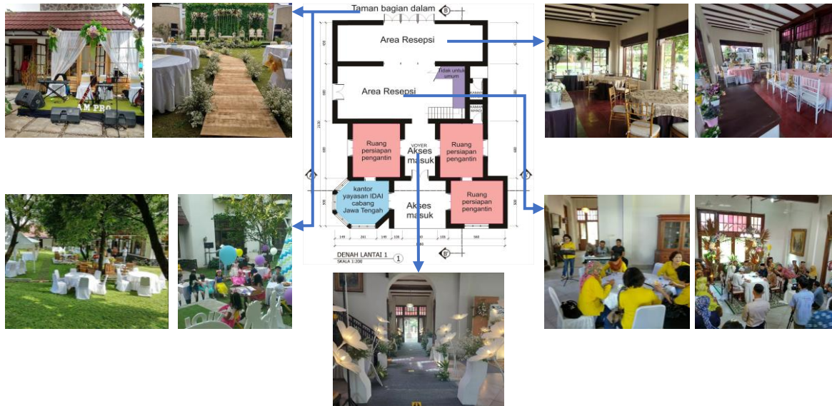
Gambar 6. Denah Penggunaan Bangunan Utama

Jawa Tengah dan ruang lainnya yang ada di lantai 1 dapat dikunjungi masyarakat umum dan juga menjadi bagian gedung yang disewakan untuk berbagai acara.