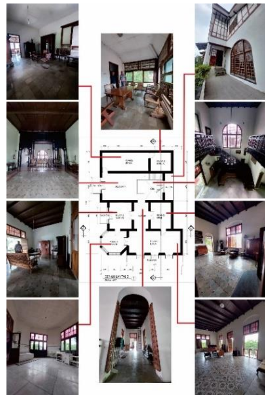
Gambar 5 Rumah Tinggal Fletterman Lt.2 Setelah Konservasi