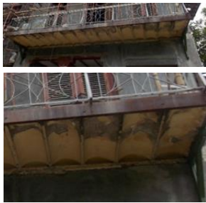
Sudah rapuh, berlumut dan tidak terawat