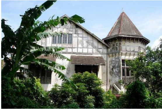
Gambar 1 Keadaan Rumah Tinggal Fletterman Sebelum Konservasi

yayasan dapat membantu melestarikan rumah Fletterman.