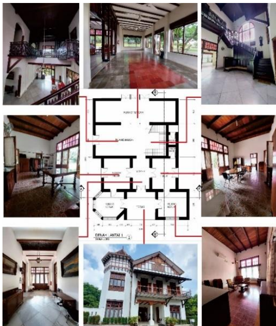
Gambar 4 Rumah Tinggal Fletterman Lt.1 Setelah Konservasi

Berikut beberapa foto keadaan ruang setelah dilakukan kegiatan konservasi dan disiapkan untuk pemanfaatan kembali bangunan Fletterman. Pada lantai 1, ruang dibuka untuk umum dan bisa disewa untuk acara sehingga tidak banyak perabot untuk memudahkan penyewa. Pada lantai 2, ruang yang ada tidak dibuka untuk umum sehingga penataan perabot dalam ruang dapat menyerupai aslinya. Dengan penempatan perabot asli pada ruang tersebut semakin mengentalkan jejak sejarah yang ada pada bangunan Fletterman.